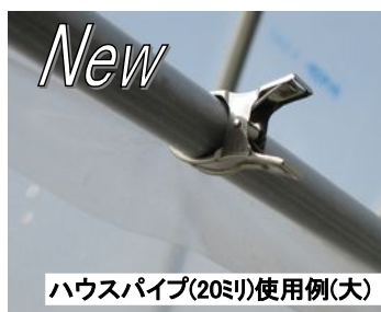
ハウスパイプ(20ミリ)使用例(大)