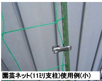
園芸ネット(11ミリ支柱)使用例(小)