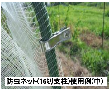
防虫ネット(16ミリ支柱)使用例(中)