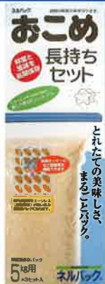
◀おこめ長持ちセット (5kg用)